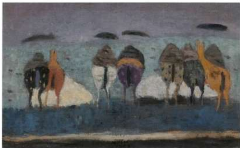
Zoran Music, "Motivo dalmata" 1952, olio su tela, cm 38x61.

La mostra, dal titolo "Zoran Music. La Collezione Braglia" rimane allestita fino al 17 dicembre presso la 'Fondazione Gabriele e Anna Braglia' (a Lugano, in Riva Caccia 6°). Si può visitare gratuitamente nei giorni di giovedì, venerdì e sabato nell'orario 10.00-13.00 / 14.30-18.30.