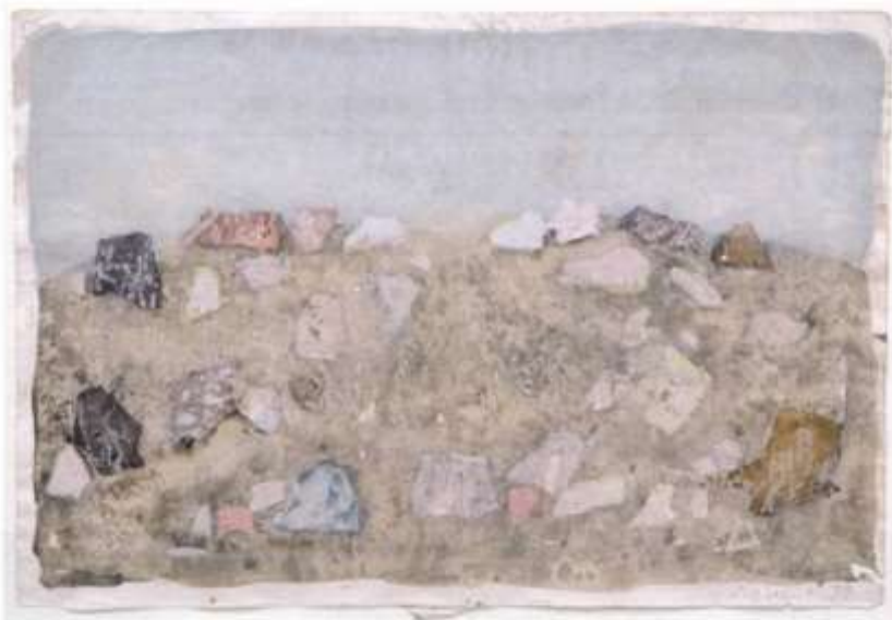
Zoran Music, "Paesaggio roccioso", 1979, acquerello su carta, cm 21x30,4.

gruppo di opere più consistente è quello degli acquerelli veneziani degli anni quaranta realizzati dopo il periodo di prigionia a Dachau.