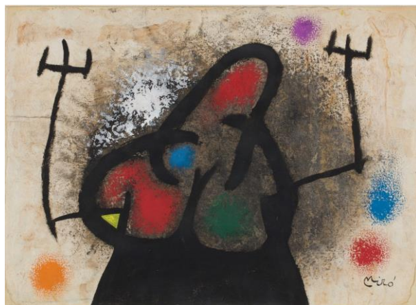
Joan Miró, Personnage , 1968, tecnica mista su "bois martelé", 27,5 x 37,6 cm © Successió Miró / 2017, ProLitteris, Zurich

Entrata gratuita e visite guidate su prenotazione (091 980 08 88 o info@fondazionebraglia.ch ).