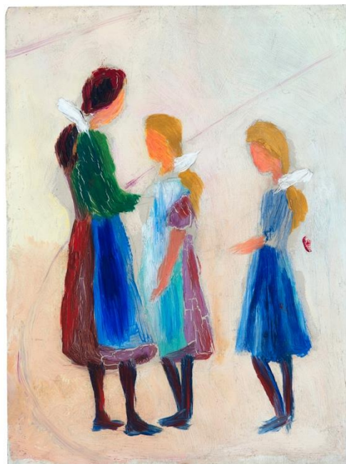
Drei Mädchen mit weissen Haarschleifen by August Macke (1914) di proprietà della Fondazione Gabriele e Anna Braglia.

Per maggiori informazioni: www.kultur-lindau.de