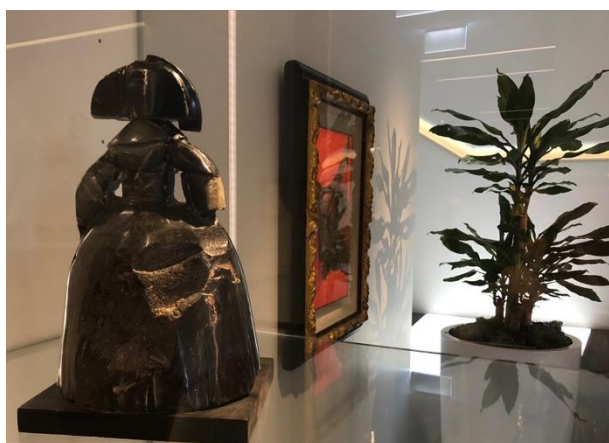
Manolo Valdés, Menina VII , 2004, pietra vulcanica, h. 25 cm

L'allestimento di Pot-pourri si arricchisce di una nuova opera arte proveniente dalla collezione Braglia. Si tratta di una scultura in pietra vulcanica, realizzata dall'artista spagnolo Manolo Valdés e intitolata Menina VII (2004). Studiare, osservare e reinterpretare i capolavori della storia dell'arte è il tratto caratteristico della pratica di Valdés. Il rimando è evidente nella serie di sculture intitolate Las Meninas , di cui fa parte la nostra, per le quali l'artista spagnolo ha preso come punto di riferimento l'omonimo dipinto realizzato da Diego Velázquez nella metà del Seicento. Menina VII offre un'armonia di echi classicheggianti che ci accompagnano verso la fine di un percorso emozionante che ha richiamato l'attenzione di oltre duemila visitatori.